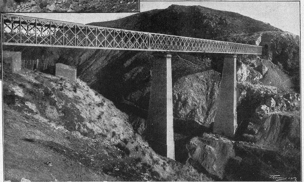
EL VIADUCTO DEL SALADO. — VISTA DEL PUENTE TENDIDO

LA ILUSTRACIÓN ARTÍSTICA, al asociarse al júbilo de que hoy se siente poseída la provincia almeriense, felicítala de todo corazón por haber visto al fin satisfechas sus